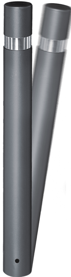
HOSPITALET DURABLE MOBIL H214FM