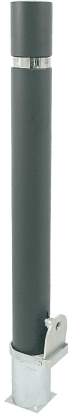
HOSPITALET DURABLE H214F