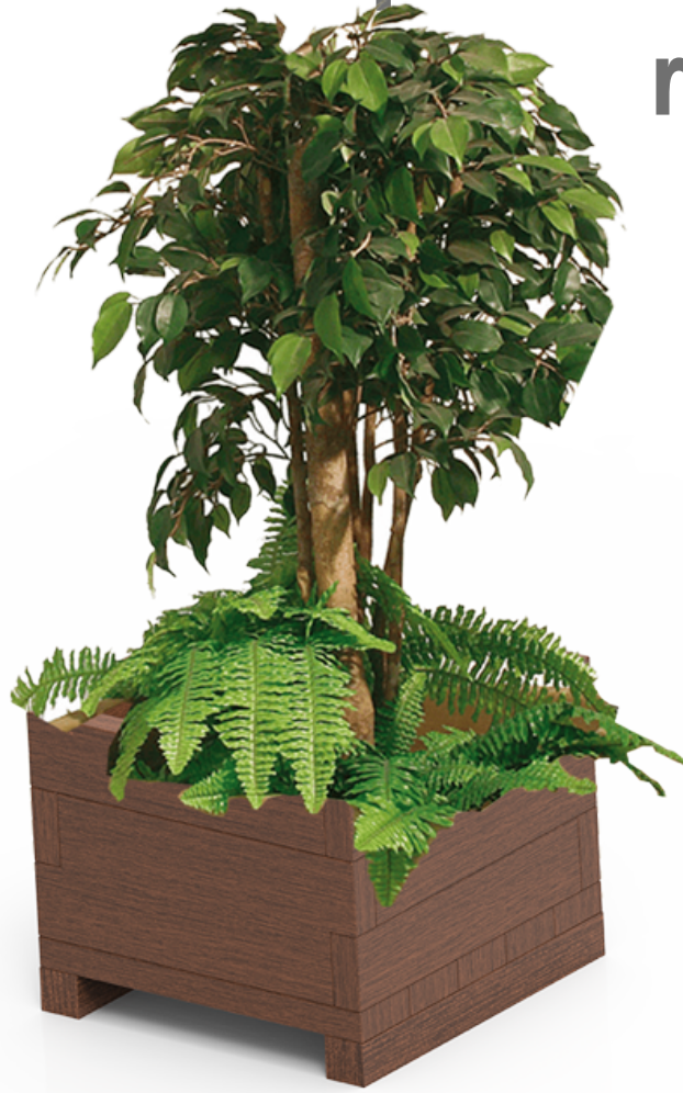
Madera polímero 100% reciclado UM1640-6PR polímero 100% reciclado UM1640-2PR polímero 100% reciclado UM1640-4PR polímero 100% reciclado UM1640-1PR