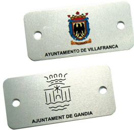
Plaqueta aluminio 74 x 35 mm.