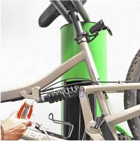
Mantenimiento y reparación de tu bici