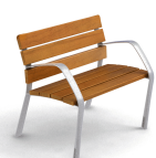
NeoBarcino ALU UM304SAL