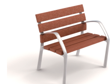
NeoBarcino ReBnew UM304NSPRH