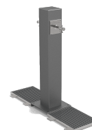
Atlas Doble UM511-2M